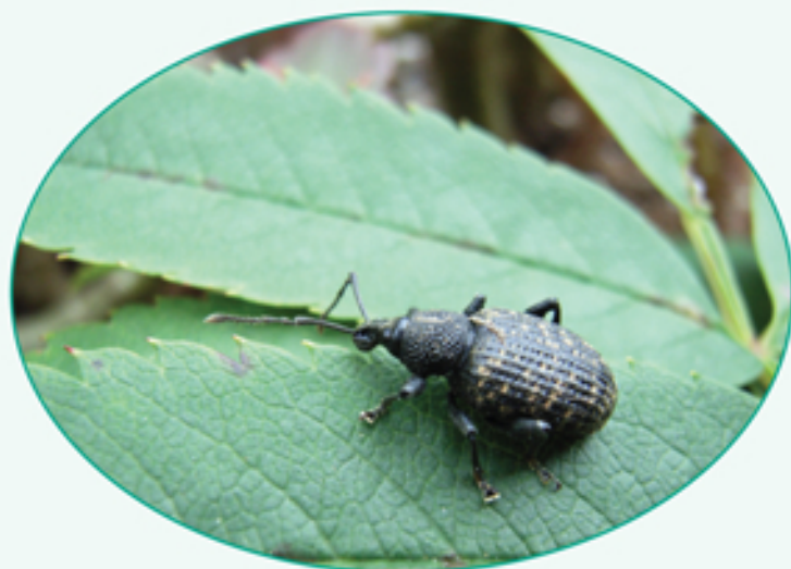
Gnag på blad

Det är därför lättast att upptäcka ett angrepp genom att hålla ögonen på skadesymptomen, som är ett karakteristiskt halvmåneformat gnag i bladkanten ("billjettklipp"). Öronvivelns larver gör emellertid ännu större skada med sitt gnag på rötterna och rothalsen. Det kan vara så ödeläggande, att stora plantor välter.